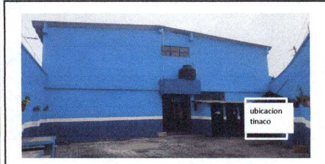
Foto 5: Suministro e instalación de tinaco de 2,800 litros con bomba hidroneomatica