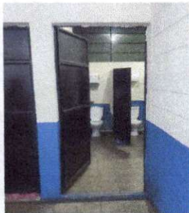
Foto 7: Remozamiento en baños de maestros, colocacion de piso antideslizante, azulejo, pintura en puertas y remozamiento en puerta de Ingreso