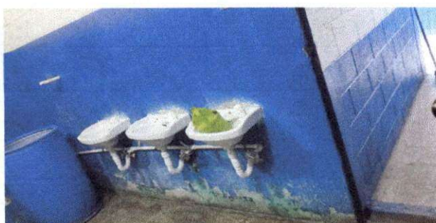
Foto 8: Remozamiento en baños de maestros, colocacion de piso antideslizante, azulejo, pintura en puertas y remozamiento en puerta de Ingreso

Observación: Si es necesario se pueden agregar hojas adicionales y actualizar el número de hojas.