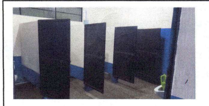
Foto 6: Remozamiento en baño de maestros, colocacion de piso antideslizante, azulejo, pintura en puertas y remozamiento en puerta de ingreso

Observación: Si es necesario se pueden agregar hojas adicionales y actualizar el número de hojas.