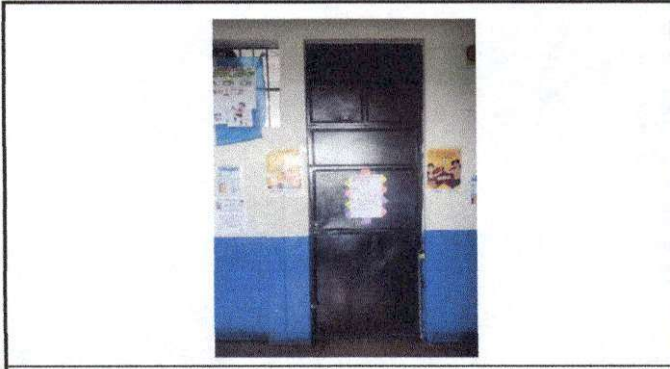
Foto 2: Puerta salon de maestros necesita cambio, esta en mal estado