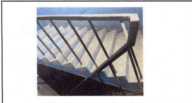
Foto 3: cambio del barandal ya esta viejo, se ha reparado pero se vuelve a abrir en las barandas puede causar daños en los alumnos, al subir se agarran de la baranda.