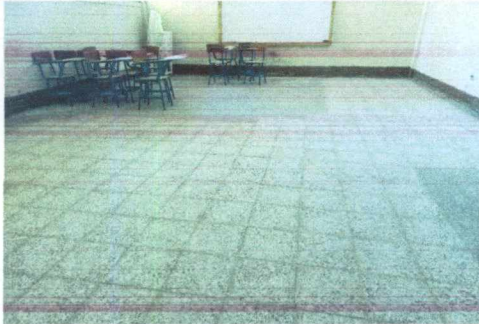
FOTO 1: SUSTITUCIÓN DE PISO DE GRANITO INCLUYENDO EXTRACCIÓN DE RAÍCES