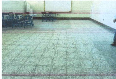
FOTO 2: SUSTITUCIÓN DE PISO DE GRANITO INCLUYENDO EXTRACCIÓN DE RAÍCES