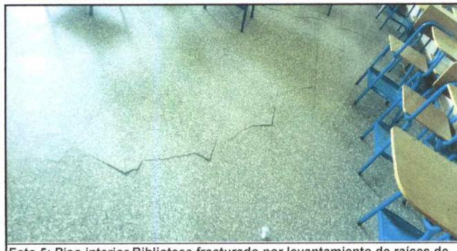
Foto 5: Piso interior Biblioteca fracturado por levantamiento de raíces de árboles