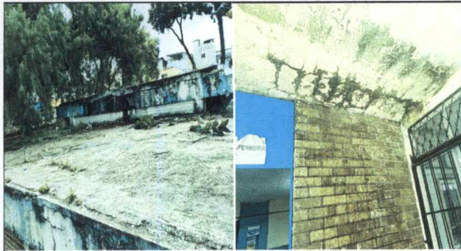
Foto 1: Techo con fractura, filtración de agua en enfermería y parte de la biblioteca