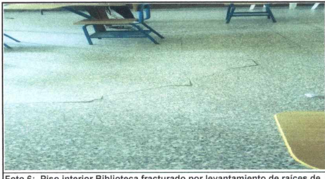
Foto 6: Piso interior Biblioteca fracturado por levantamiento de raíces de árboles

Observación: Si es necesario se pueden agregar hojas adicionales y actualizar el número de hojas.