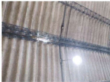
Foto1: Sustitución de capote de lámina para lámina duralita (ujeros)