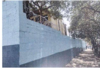
FOTO 8: Levantamiento de muro perimetral ya existente de block con tubo gh, malla galvanizada, soleras intermedias y columnas.

Observación: Si es necesario se pueden agregar hojas adicionales y actualizar el número de hojas.