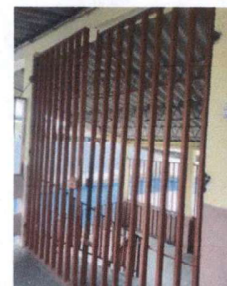
foto 6: Mantenimiento a barrandas (Chapa, lija, pintura, desmontaje, nivelar, incluye cambio de rejas que estan occidadas)

Observación: Si es necesario se pueden agregar hojas adicionales y actualizar el número de Hojas.