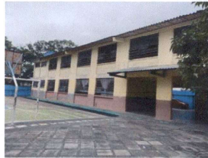
Foto 2: Mantenimiento a estructura de metal de ventanas incluye limpieza de vidrios