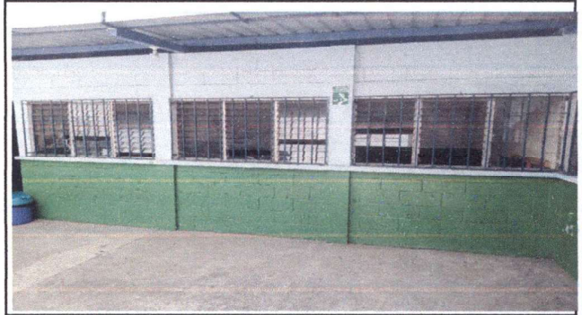
Foto 2: Cambio de ventanas por ventanas corredizas tipo PVC de 5mm