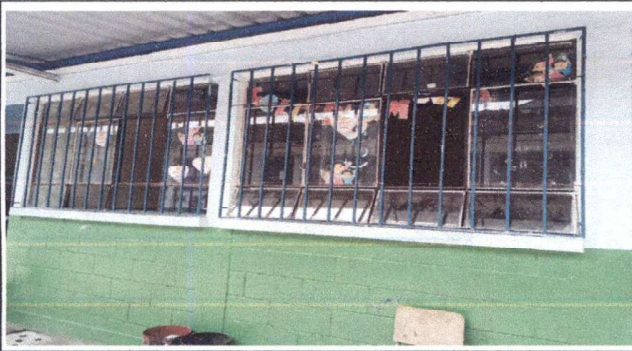
Foto 3: Cambio de ventanas por ventanas corredizas tipo PVC de 5 mm