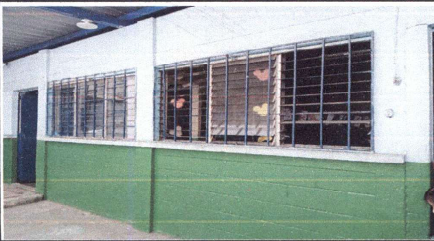
Ventanas descripción: Cambio de ventanas por ventanas corredizas tipo PVC de 5mm