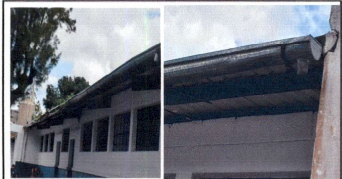
Eliminación de canales para evitar que los salones se inunden cuando llueve.