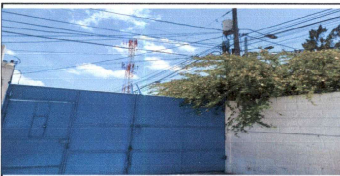
Muro perimetral con los árboles ya podados por la Municipalidad para poder realizar el trabajo que se necesita para protección de las alumnas, docentes y escuela, donde se colocará Razon nuevo de Acero Inoxidable