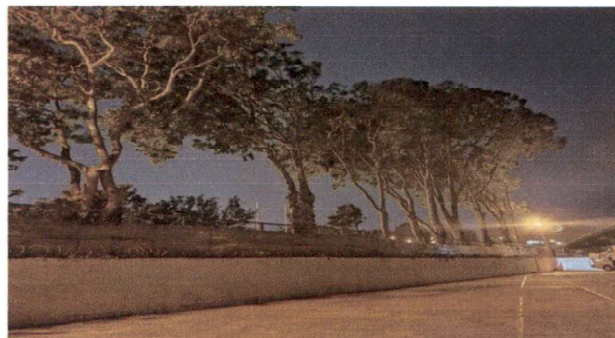
Muro perimetral con los árboles ya podados por la Municipalidad para poder realizar el trabajo que se necesita para protección de las alumnas, docentes y escuela, donde se colocará Razon nuevo de Acero Inoxidable