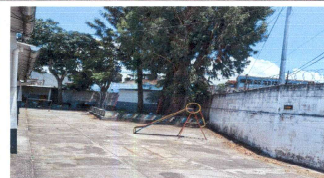
Muro perimetral con los árboles ya podados por la Municipalidad para poder realizar el trabajo que se necesita para protección de las alumnas, docentes y escuela, donde se colocará Razon nuevo de Acero Inoxidable