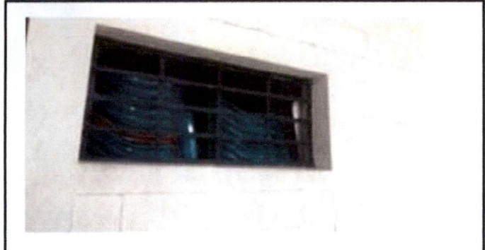
Bodega se instalará cedazo, iluminación con lámpara Led, tomacorrientes para poder guardar los alimentos para la cocina.