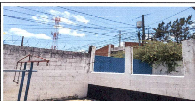
Muro perimetral con los árboles ya podados por la Municipalidad para poder realizar el trabajo que se necesita para protección de las alumnas, docentes y escuela, donde se colocará Razon nuevo de Acero Inoxidable

Observación: Si es necesario se pueden agregar hojas adicionales y actualizar el número de hojas.