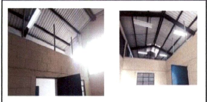
Pinura de salón de maestros está en mal estado. Pintar de nuevo el salón de maestros.