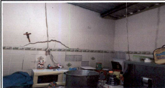
Remozamiento de cocina para dar un mejor servicio y preparación de alimentos. Quitar azulejos de top y de paredes existentes. Quitar repello de muros que se están cayendo.