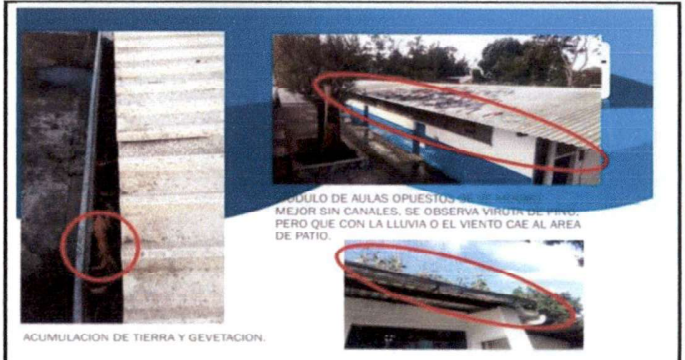
Eliminación de canales para evitar que los salones se inunden cuando llueve ya que están llenas de hojas de árboles.