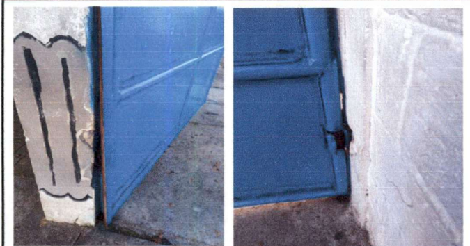
Reparación de Portón de entrada para protección de la escuela.