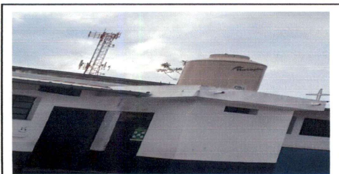
Colocar llave de paso y llave cheque a tinaco de agua potable.