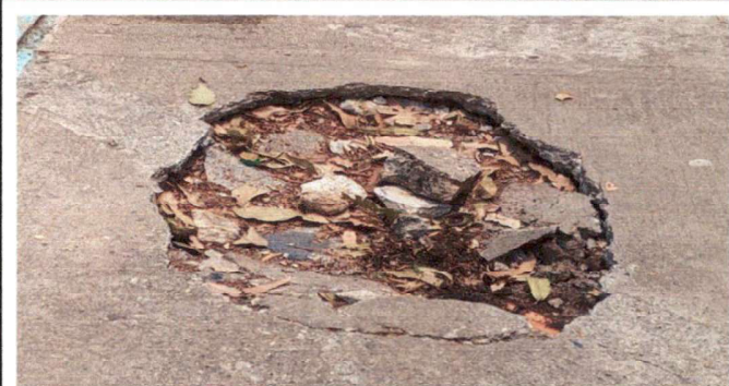
Reparación de agujero que se abrió cerca del sanitario de las alumans. Fundir con concreto.