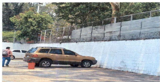
Muro perimetral en el cual se corre el riesgo de que personas ajenas entren a la escuela. Se realizará mantenimiento a 94 mts. De Razon existente.