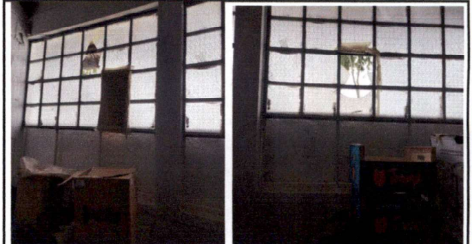
Biblioteca instalación de vidrios de ventanas y colocación de puerta de rejas para protección de material de valor.