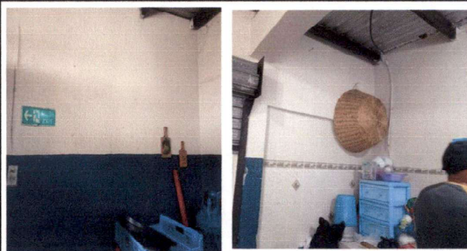
Instalación de azulejo nuevo, aplicar pintura en los muros