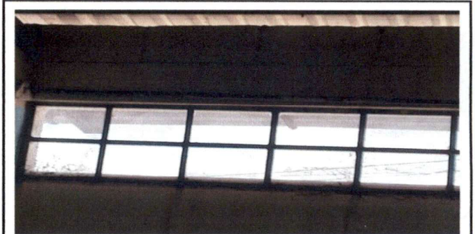
Cambio de cedazo, pinturar paredes de dirección y colocación de puerta de rejas para protección de papelería y materiales.

Observación: Si es necesario se pueden agregar hojas adicionales y actualizar el número de hojas.