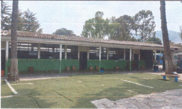
Foto1: cambio de techo aulas 2do y 3ro