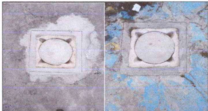
Foto 4: CAMBIO DE DOS REPOSADERAS DE PATIO, YA QUE ESTAN RAJADAS Y EN MUY MAL ESTADO.