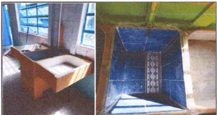
Foto 3: SUSTITUCIÓN DE PILA DE CONCRETO EN COCINA, YA QUE ESTA RAJADA Y EN MAL ESTADO.