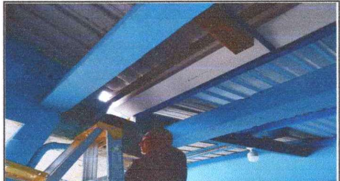
Foto 2: SUSTITUCIÓN Y REPARACIÓN DE CAIDAS DE AGUA PLUVIAL , SUSTITUCIÓN DE SOPORTES DE METAL PARA CANAL.