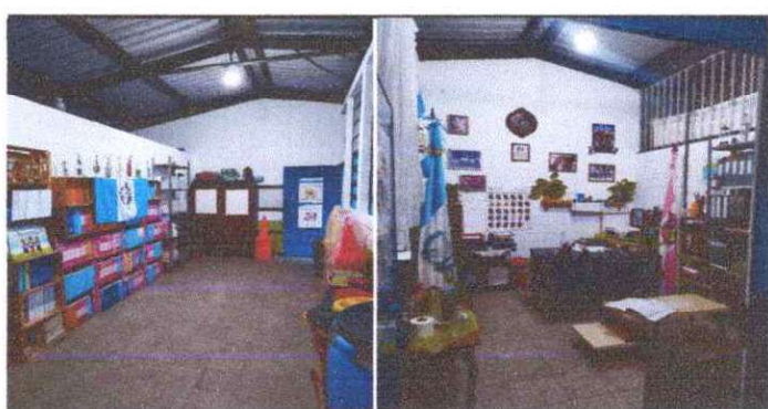
Foto 6: PINTURA EN TRES AULAS, DIRECCIONES MATUTINA, VESPERTINA CON BODEGAS Y DIRECCIÓN NOCTURNA.

Observación: Si es necesario se pueden agregar hojas adicionales y actualizar el número de hojas.