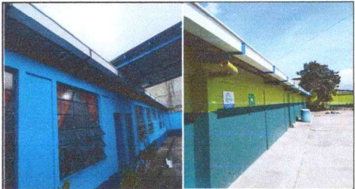
Foto 1: SUSTITUCIÓN DE CANALES YA QUE ESTAN OXIDADOS Y EN MUY MAL ESTADO.