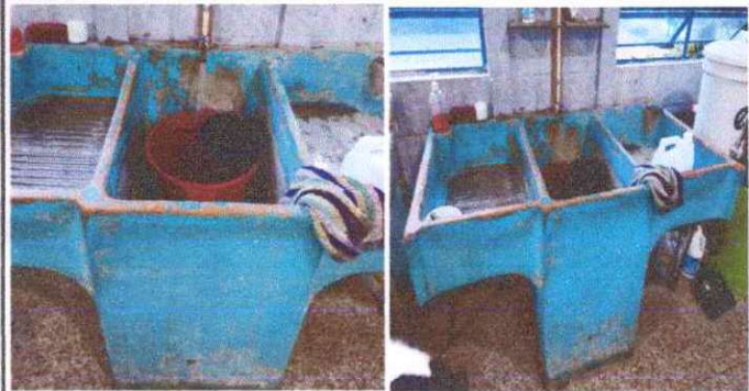
Foto 3: SUSTITUCIÓN DE PILA DE CONCRETO EN COCINA, YA QUE ESTA RAJADA Y EN MAL ESTADO.