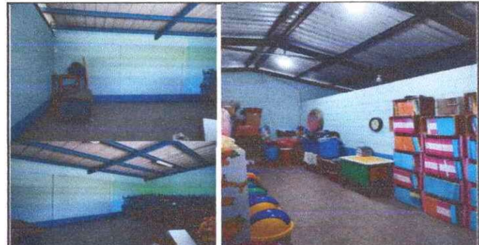
Foto 6: PINTURA EN TRES AULAS, DIRECCIONES MATUTINA, VESPERTINA CON BODEGAS Y DIRECCIÓN NOCTURNA.

Observación: Si es necesario se pueden agregar hojas adicionales y actualizar el número de hojas.