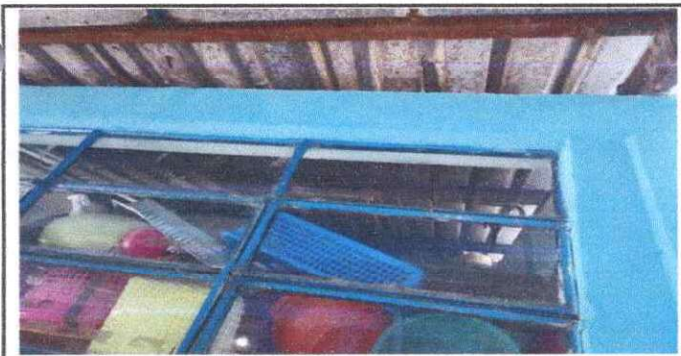
Foto 5: SUSTITUCIÓN DE LAMINA POR LAMINA ALIZINC CALIBRE 26 EN GUARDIANIA YA QUE ESTA EN MAL ESTADO, PICADA Y MANTENIMIENTO A ESTRUCTURA DE LAMINA.