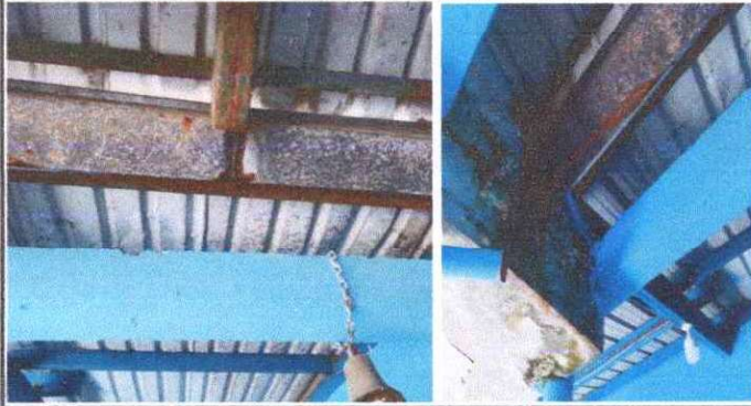
Foto 1: SUSTITUCION DE CANALES YA QUE ESTAN OXIDADOS Y EN MUY MAL ESTADO.