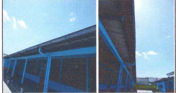
Foto 2: SUSTITUCIÓN Y REPARACIÓN DE CAIDAS DE AGUA PLUVIAL , SUSTITUCIÓN DE SOPORTES DE METAL PARA CANAL.