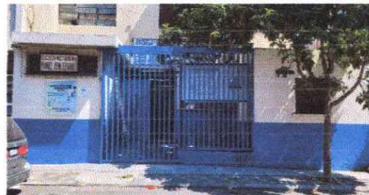
Foto 18: Instalar reja en la entrada principal de la escuela para evitar que los indigentes realicen sus necesidades biologicas en la entra de principal, que tomen bebidas alcoholicas y duermen .

Observación: Si es necesario se pueden agregar hojas adicionales y actualizar el número de hojas.