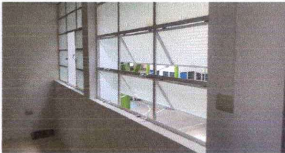
Foto 17: Ventas del segundo nivel estan selladas se modificarán para que entre ventilación.