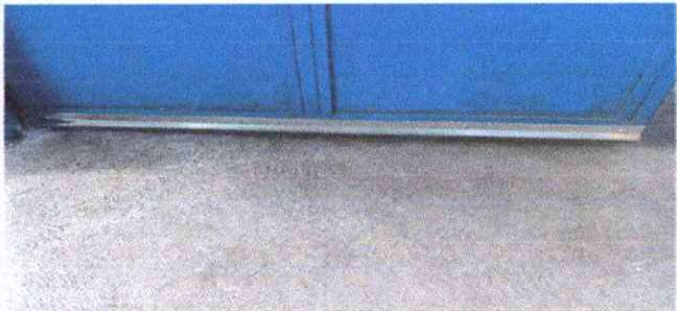
Foto 20: .Guarda polovos en las puertas para evitar que eantren roedores en los salón de clases y eb cocina