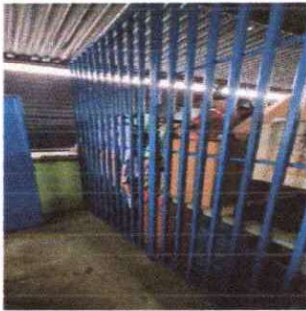
Foto 19: Instalación de reja en la bodega del segundo nivel para separar la cocina de la j.v con la bodega de la j.m