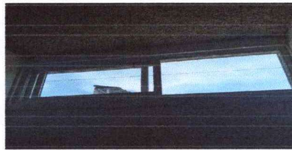
Foto 22. ventan pvc

Observación: Si es necesario se pueden agregar hojas adicionales y actualizar el número de hojas.