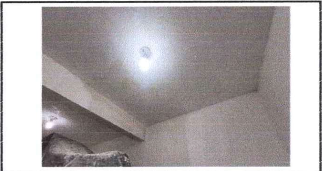
Foto 4: Sustitución de repello de todas las paredes y cielo de la oficina de supervisión