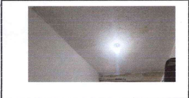
Foto 5: Sustitución de repello de todas las paredes y cielo de la oficina de supervisión