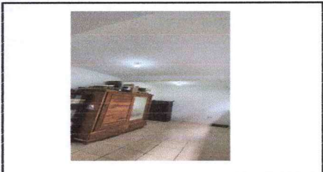
Foto 3: Sustitución de repello de todas las paredes y cielo de la oficina de supervisión