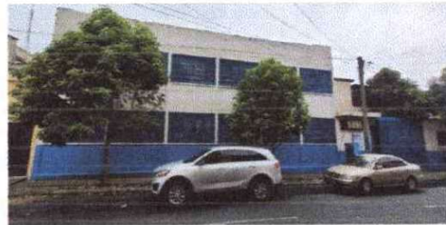
Foto 10: Sustitucion de malla de las ventanas exteriores de la escuela