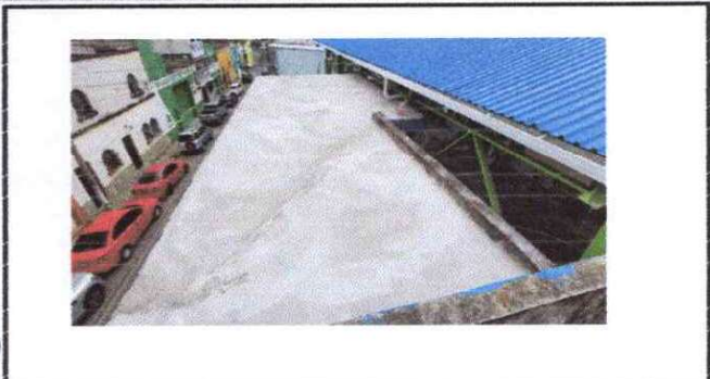
Foto1: Finalización de los trabajos de Remoción de mezcón existente, limpieza y elaboración de pañuelos de mezcón nuevos, impermeabilización de área