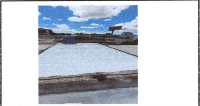
Foto 2: Remoción de mezcón existente, limpieza y elaboración de pañuelos de mezcón nuevos, impermeabilización de área