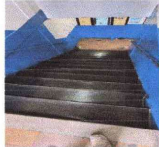
Foto 16 ; Sustitucion de alfombra de trafico pesado existente de gradas de escuela