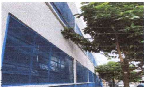
Foto 11: Sustitucion de malla de las ventanas exteriores de la escuela