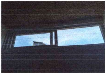
Foto 21. Venta de pvc en el segundo nivel