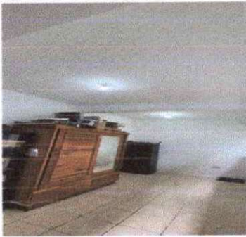
Foto7: Aplicación de pintura