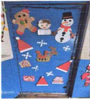
Foto .Guarda polovos en las puertas para evitar que eantren roedores en los salón de clases y eb cocina