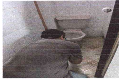
Foto 19. Se está desinstalando el inodoro en el primer nivel de maestros j. m