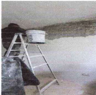
Foto 5: Sustitucion de repello de todas las paredes y cielo de la oficina de supervision