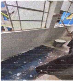
Foto7: Aplicación de pintura