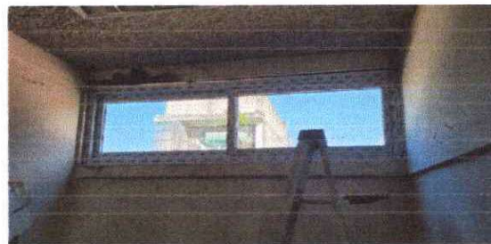
Foto 23. colocando la ventana de pvc

Observación: Si es necesario se pueden agregar hojas adicionales y actualizar el número de hojas.