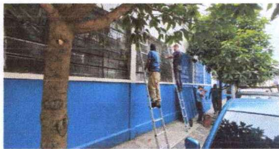
Foto 11: Sustitucion de malla de las ventanas exteriores de la escuela