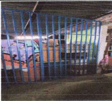
Foto 20: Instalación de reja en la bodega del segundo nivel para separar la cocina de la j.v con la bodega de la j.m