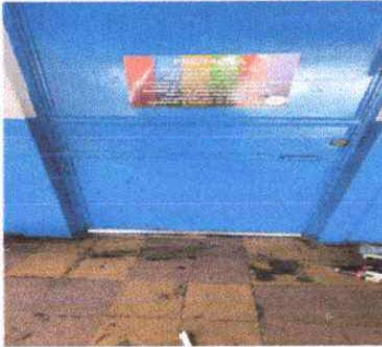
Foto 18. Guarda polvos en las puertas para evitar que entren roedores en los salones de clases y en la cocina