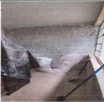
Foto 3:Sustitucion de repello de todas las paredes y cielo de la oficina de supervision