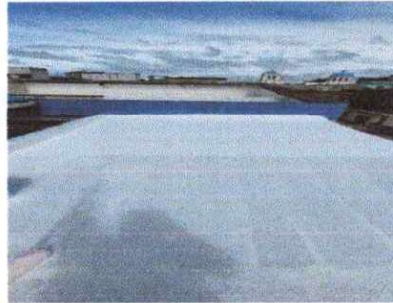
Foto , impermeabilización de área