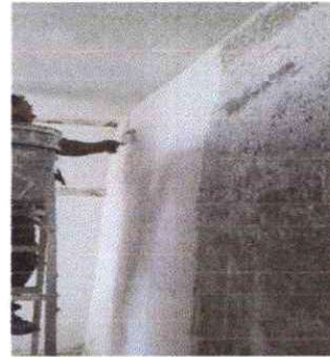
Foto 4:Sustitucion de repello de todas las paredes y cielo de la oficina de supervision