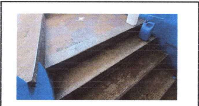
Foto 16: Colocando alfombra de trafico pesado existente de gradas de escuela