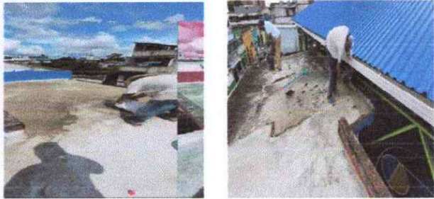
Foto1: Remoción de mezcón existente, limpieza y elaboración de pañuelos de mezcón nuevos, impermeabilización de área