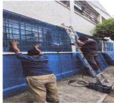
Foto 10: Se estan cambiando las de malla de las ventanas exteriores de la escuela