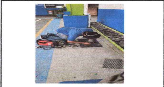
Foto 14: Acondicionamiento de reposaderas de escuela se les colocará malla para evitar que los niños depositen basura y que los ratones sigan saliendo de las reposadera.