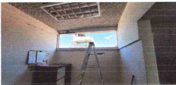
Foto 22. colocación de la ventana de pvc.