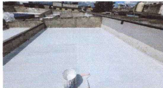
Foto 6: Limpieza y aplicación de impermeabilizante a losa de aulas de escuela 338 metros cuadrados

Observación: Si es necesario se pueden agregar hojas adicionales y actualizar el número de hojas.