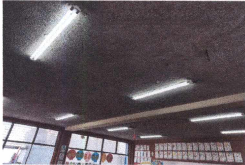
FOTO 1: SUSTITUCIÓN DE LÁMPARAS TIPO LED DE DOS LISTONES EN AULAS