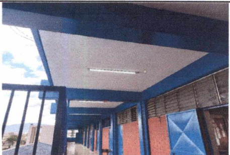
FOTO 3: SUSTITUCIÓN DE LÁMPARAS TIPO LED DE 1 LISTÓN EN CORREDORES