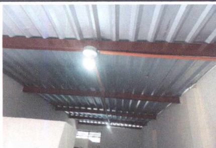
FOTO 3: SUSTITUCIÓN DE ESTRUCTURA DE SOPORTE DE METAL E INSTALACIÓN DE LÁMINA TROQUELADA