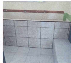
FOTO 6: INSTALACIÓN DE AZULEJO EN SERVICIOS SANITARIOS (PARA COMPLETAR 4M2 FALTANTES DE INSTALACIÓN DE PISO)