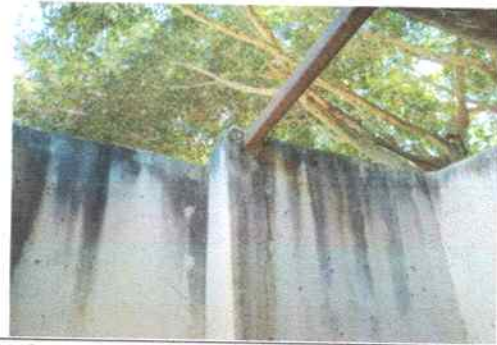
Limpieza de muros