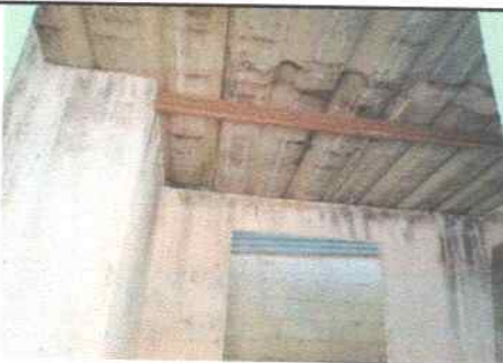
Ausencia de ventanas