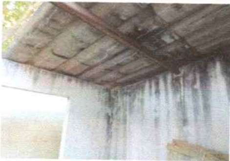
Estructura de Techo en mal estado