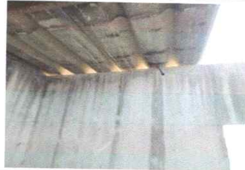
Estructura de techo en mal estado