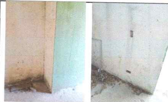
Ausencia de piso

Observación: Si es necesario se pueden agregar hojas adicionales y actualizar el número de hojas.