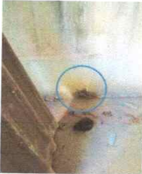
Resane de agujero en la base del muro