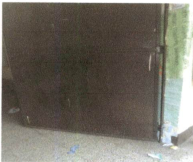
Foto 3: Mantenimiento a estructura (lijado, cambio de tubo , cepillado, sujeciones, aplicación de pintura)