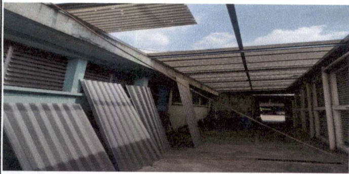
Foto1: Sustitución de lámina, por lámina troquelada aluzinc calibre 26 (10 pies) desinstalación, instalación, pintura y mano de obra.