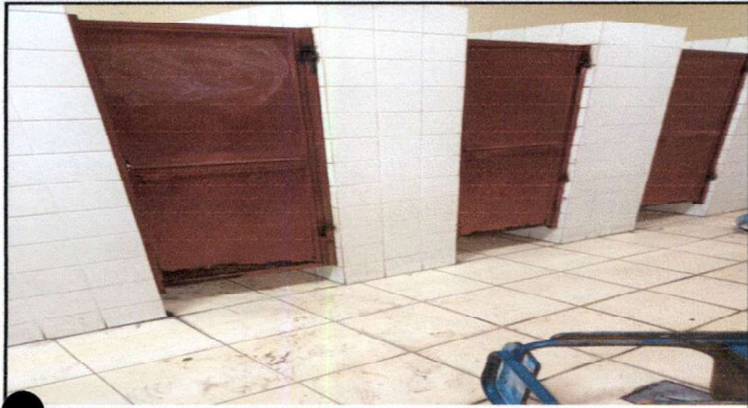
• Instalación de puerta de metal para sanitario (0.57 * 1.50)