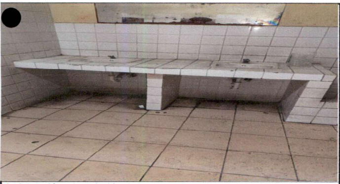
desinstalación e instalación de lavamanos