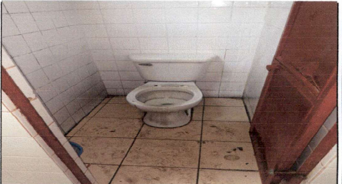
desinstalación e instalación de sanitarios color blanco marca Corona de push