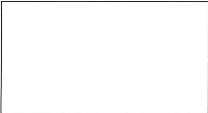
pintura en muros y techo interior