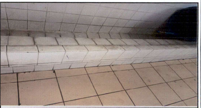
instalación de urinal (definir marca)

Observación: Si es necesario se pueden agregar hojas adicionales y actualizar el número de hojas.