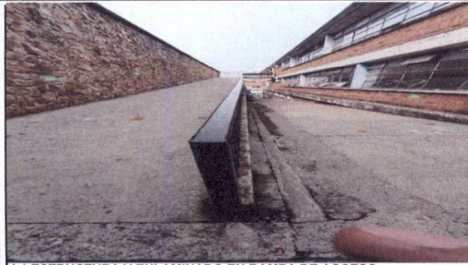
1.1 ESTRUCTURA Y ENLAMINADO EN RAMPA DE ACCESO