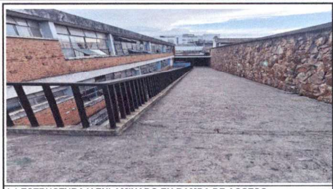
1.1 ESTRUCTURA Y ENLAMINADO EN RAMPA DE ACCESO