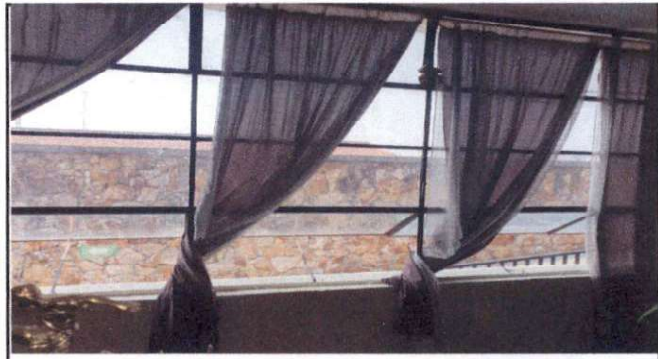
5.1 Y 5.3 MODIFICACIÓN DE VENTANA A CORREDIZA Y LIMPIEZA. APLICACIÓN GENERAL DE SILICONE A VIDRIOS GENERAL