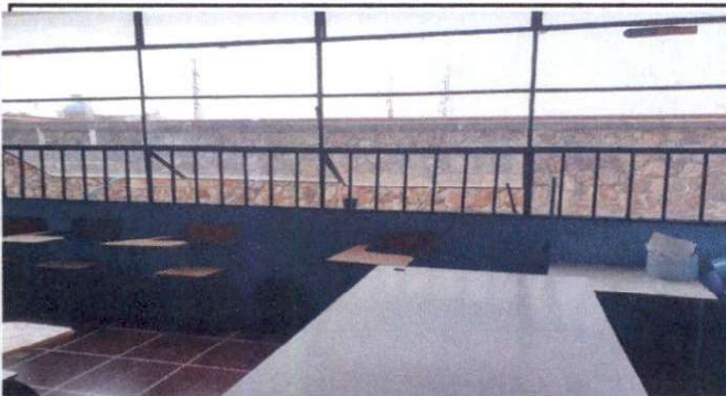
5.2 CAMBIO DE VIDRIOS Y LIMPIEZA DE VIDRIERA POR FILTRACIONES VIDRIO DE 5MM