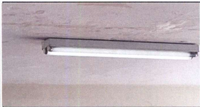
17.3 y 17.4 INSTALACIÓN DE BOMBILLAS Y TOMACORRIENTES