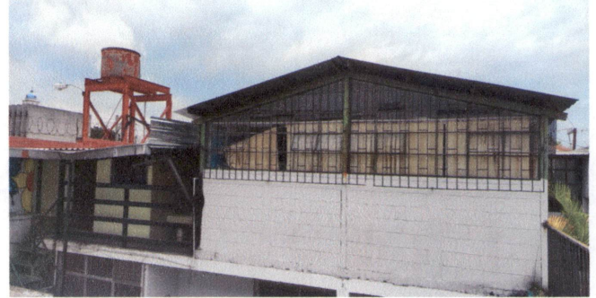
FOTO 2: Sustrucción de lámina, por lámina troquelada aluzinc calibre 26 para cubrir espacios entre techo y ventaneria