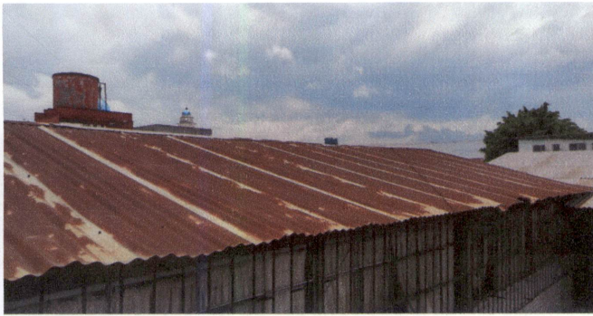
FOTO 1: Sustrucción de lámina, por lámina troquelada aluzinc calibre 26