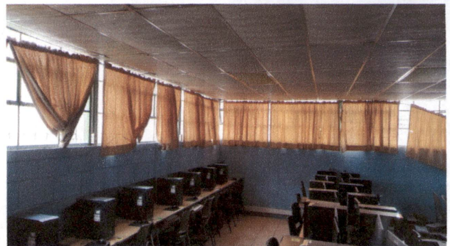
FOTO 6: Sustrucción de lamparas tipo LED (INCLUYE CAMBIO DE CABLEADO Y DUCTO)

Observación: Si es necesario se pueden agregar hojas adicionales y actualizar el número de hojas.