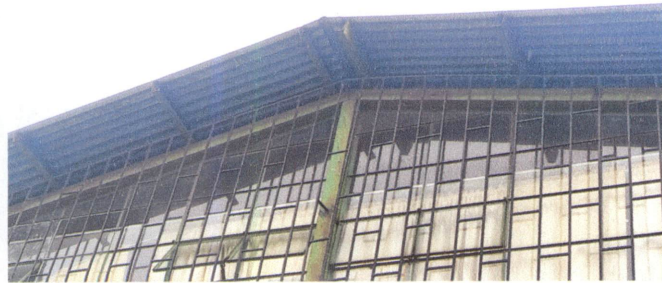
FOTO 3: Sustrucción de estructura de soporte de metal, por metal, más pintura