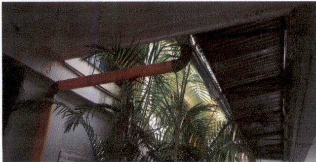
FOTO 5: Reparación de bajada de agua pluvial, tubo PVC 4 con accesorios