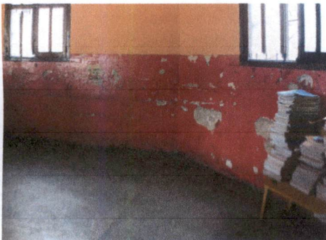
FOTO: PINTURA EN MUROS EXTERIORES E INTERIORES