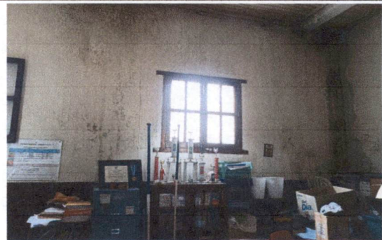
FOTO 4: Mejoramiento de losa, con impermeabilizante elastomérico de tipo acrílico estirenado de tipo acrílico uso para losa y paredes, vida útil de 8 años. Con espesor de 7 milis para su correcto funcionamiento.

Observación: Si es necesario se pueden agregar hojas adicionales y actualizar el número de hojas.