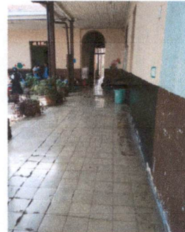
FOTO: PINTURA EN MUROS EXTERIORES E INTERIORES