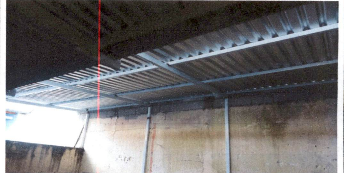
Foto 4: Instalación de la lamina troquelada en el area de la cocina.