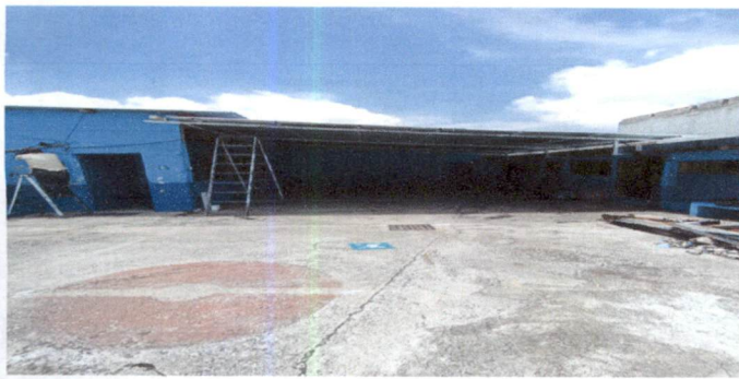
Foto 3: Instalación de los cables del servicio de la luz dd el area del techado exterior.