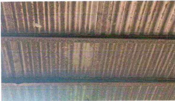
Foto 3: 2.3 Sustitución de estructura de soporte de metal, por metal