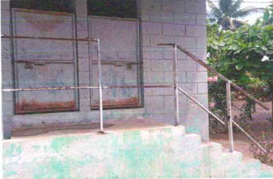
Foto7: 11.2 Sustitución de barandas de metal