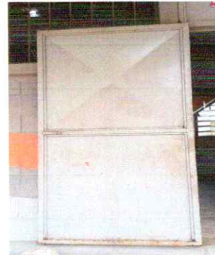
Foto 4: 4.1 Mantenimiento a estructura (lijado, cambio de tubo, cepillado, sujeciones, aplicación de pintura)