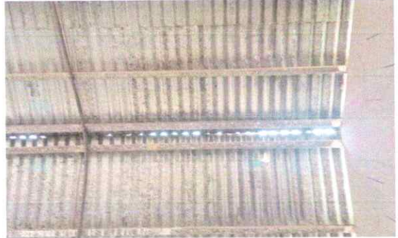
Foto 2: 1.2 Sustitución de capote de lámina para lámina troquelada