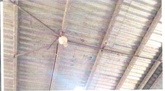
Foto8: 17 Reparación de Sistema Eléctrico