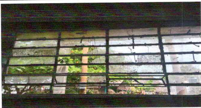
Foto9: 19.2 Fabricación e instalación de balcones de hierro en ventana