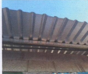
FOTO 2: ESTRUCTURA DE TECHO (mantenimiento de estructura y sustitución de soporte de madera por metal)