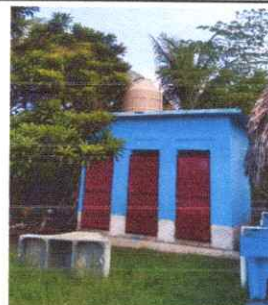
Foto 12: REPARACIÓN Y MANTENIMIENTO DE CISTERNA / DEPÓSITO DE AGUA

Observación: Si es necesario se pueden agregar hojas adicionales hasta el número de hojas.