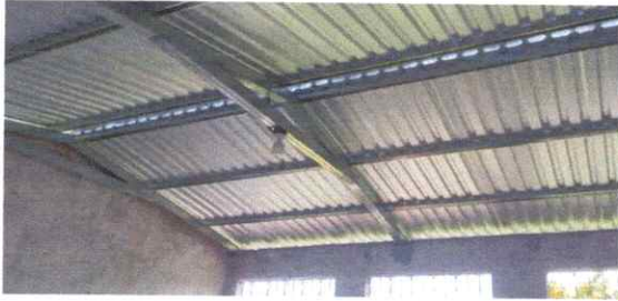
Foto1: CUBIERTA DE LÁMINA MODULO 1