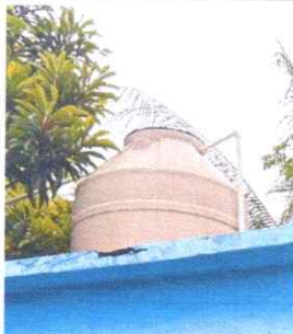
Foto 11: REPARACIÓN Y MANTENIMIENTO DE CISTERNA / DEPÓSITO DE AGUA