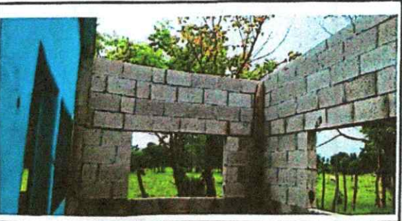
Reparación de cocina