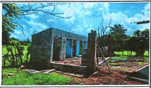
Reparación de baños