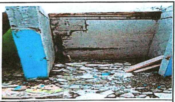
Sustitución de torta de cemento por piso