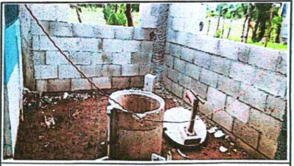
Reparación de pozo