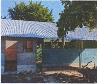
FOTO 1: CUBIERTA DE LÁMINA (sustitución de lámina, sustitución de capote)