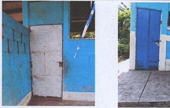
FOTO 3: PUERTA DE METAL (Mantenimiento a estructura (lijado, cambio de tubo, cepillado, sujeción, aplicación de pintura)