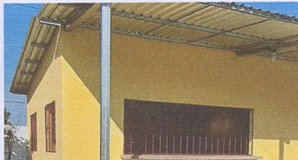
Foto 2: 5.2 SUSTITUCIÓN DE ESTRUCTURA DE METAL DE VENTANA EN COCINA