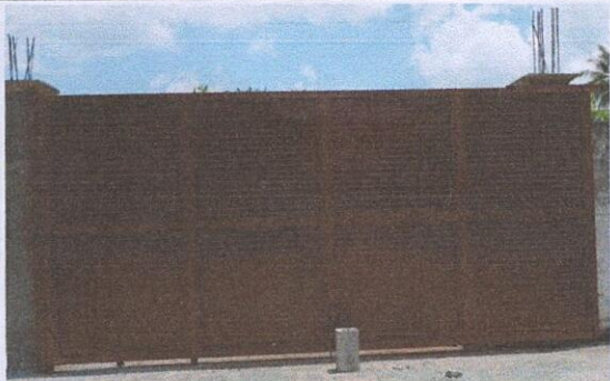
Foto1: 4.5 SUSTITUCIÓN DE PORTÓN DE METAL