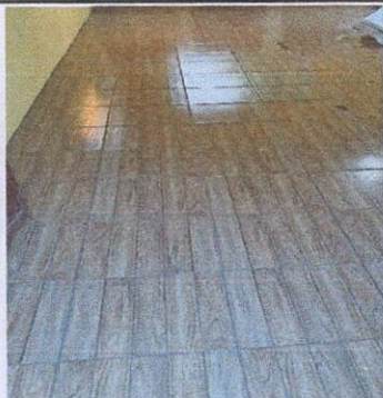
Foto 3: 6.5 SUSTITUCIÓN DE PISO DE TORTA DE CONCRETO EN CORREDOR DE PISO DE AULAS A LA PAR DE DIRECCIÓN