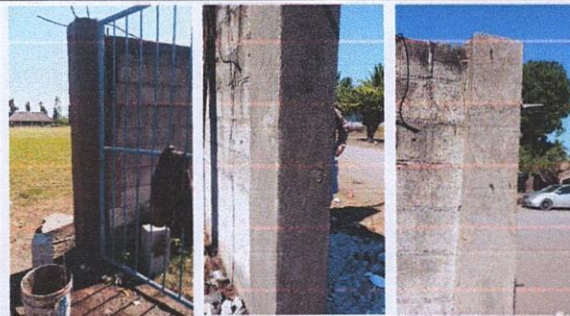
Foto 6: REPARACION DE REPELLO Y CERNIDO DE PAREDES: repello en muro y cernido

Observación: Si es necesario se pueden agregar hojas adicionales y actualizar el número de hojas.