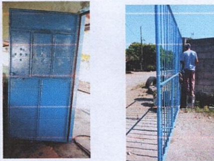
Foto 3: PUERTAS DE METAL: Sustitución de chapa, puerta y portón de metal