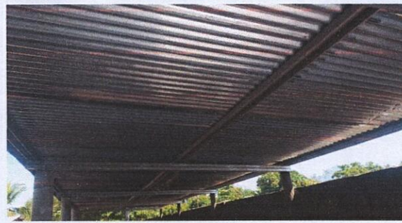
Foto 2: ESTRUCTURA DE TECHO: Sustitución de estructura de soporte