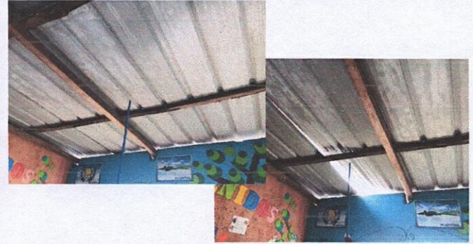
Foto 2: 1.2 sustitución de capote de lámina para lámina troquelada en aulas