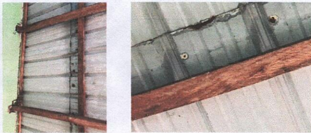
Foto 3: 2.3 Sustitución de estructura de soporte de metal, por metal en las aulas.