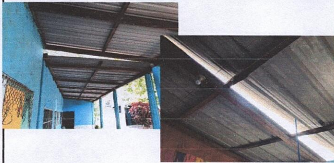
Foto 1: 1.1 sustitución de lámina, por lámina troquelada Aluzinc calibre 26 en aulas