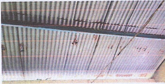
Foto 1: 1.1 Sustitución de lámina, por lámina troquelada aluzinc calibre 26 en cocina y sanitarios