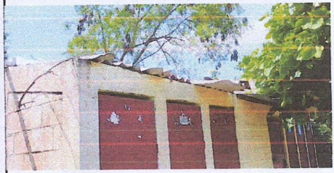
Foto 2: 4.1 Mantenimiento a estructura (lijado, cambio de tubo, cepillado, sujetiones, aplicación de pintura) en puertas de baño