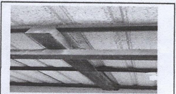
Foto 4: Sustrucción de lámina, por lámina troquelada aluzinc calibre 26