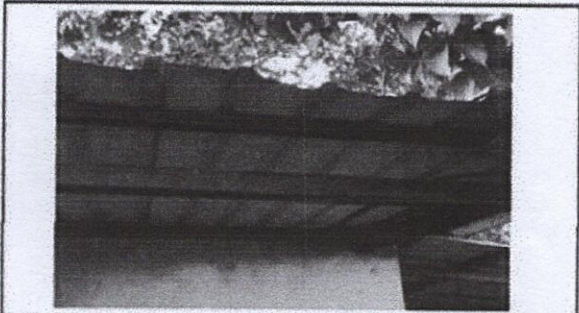
Foto 3: Sustrucción de lámina, por lámina troquelada aluzinc calibre 26