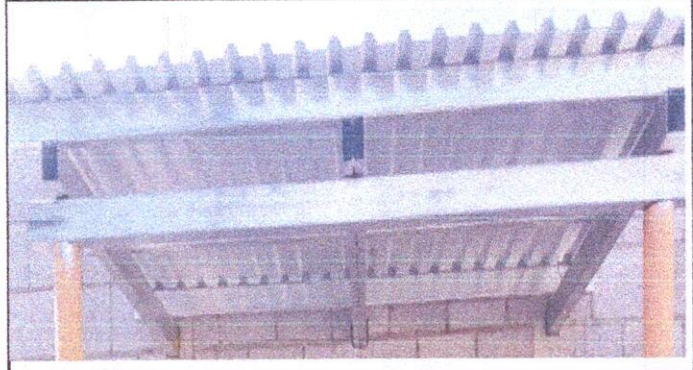
2.2 sustitucion de estructura de soporte madera por metal