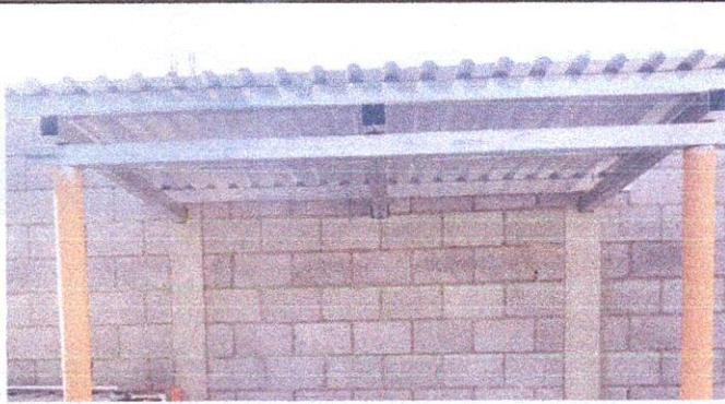
1.1 Sustitucion lamina por lamina troquelada aluzinc calibre 26