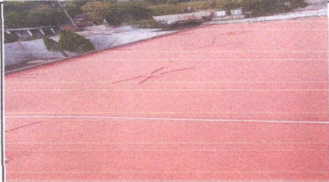
3.1 Impermeabilizacion de losa