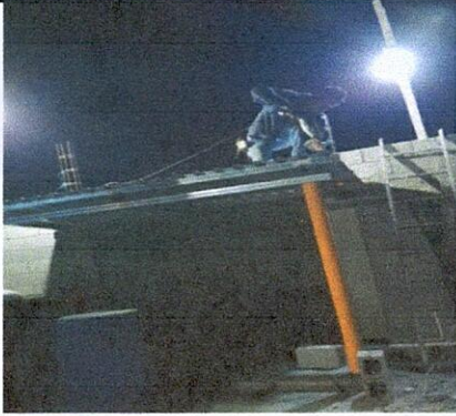
1.1 Sustitución lamina por lamina troquelada aluzinc calibre 26