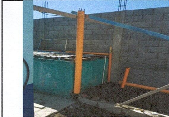
2.2 sustitucion de estructura de soporte madera por metal