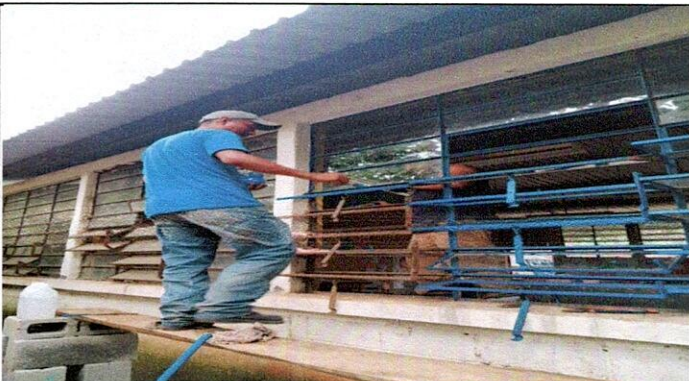
Foto 3: 5 VENTANAS: 5.1 Mantenimiento a estructura de metal de ventana, 5.2 sustitución de estructura de metal de ventana