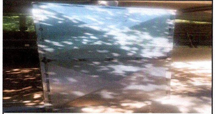
Foto 2: 4 PUERTAS DE METAL: 4.4 Sustitución de puertas en servicios sanitarios