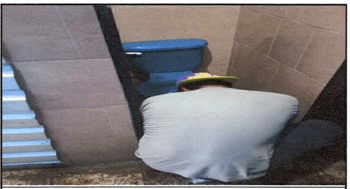
Foto 6: SERVICIOS SANITARIOS Y SUS ACCESORIOS 10.3 Sustitución de inodoro

Observación: Si es necesario se pueden agregar hojas adicionales y actualizar el número de hojas.