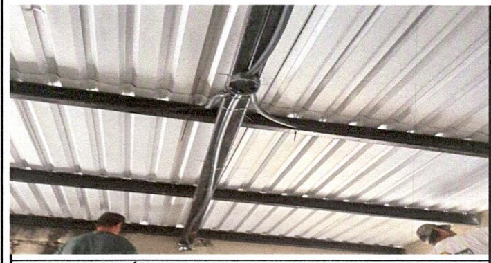
Foto 5: REPARACIÓN DE SISTEMA ELECTRICO 17.11 Reparación de cableado electrico