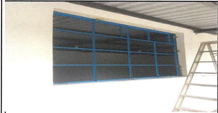
Foto1: VENTANAS 5.3 Sustitución de ventana de madera por metal más vidrio