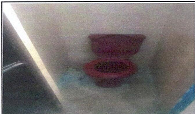
Foto 6: SERVICIOS SANITARIOS Y SUS ACCESORIOS 10.3 Sustitución de inodoro

Observación: Si es necesario se pueden agregar hojas adicionales y actualizar el número de hojas.