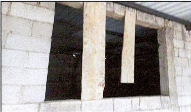
Foto 1: VENTANAS 5.3 Sustitución de ventana de madera por metal más vidrio