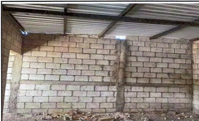
Foto 4: REPARACIÓN DE REPELLO Y CERNIDO DE PAREDES 21.1 Repello en muro 21.2 Cernido en muro