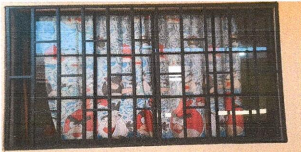
Foto 6: VENTANAS 5.2 Sustitución de estructura de metal de ventana 5.5 Sustitución de vidrios

Observación: Si es necesario se pueden agregar hojas adicionales y actualizar el número de hojas.