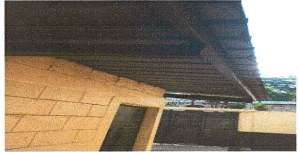
Foto 3: ESTRUCTURA DE TECHO 2.2 Mantenimiento a estructura de soporte de metal