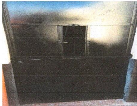
Foto 4: PUERTAS DE METAL 4.1 Mantenimiento a estructura (lijado, cambio de tubo, cepillado, sujeciones, aplicación de pintura)