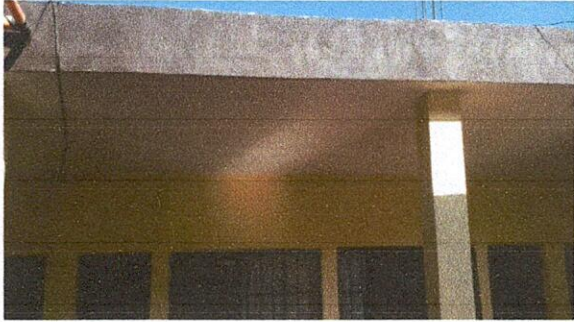
Foto 1: CUBIERTA DE LOSA 1.1. Sustitución de cubierta de lámina por cubierta de losa