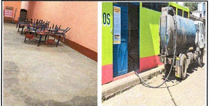
Foto 4: reparación de red de drenaje y red de agua potable. 14.6 limpieza de fosa séptica