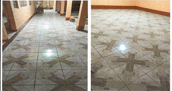
Foto2: PISO 6.8 Sustitución de piso cerámico