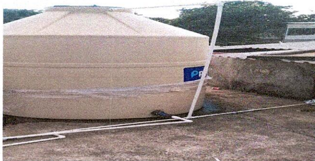
Foto 7: REPARACIÓN Y MANTENIMIENTO DE CISTERNAS / DEPÓSITOS DE AGUA 18.3 Sustitución de depósito de agua de 1,700 litros

Observación: Si es necesario se pueden agregar hojas adicionales y actualizar el número de hojas.