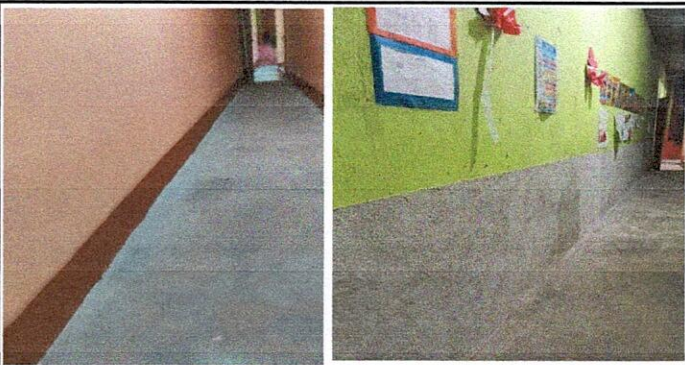
Foto 5: Muros perimetrales 15.1 Reparación de muro perimetral de block