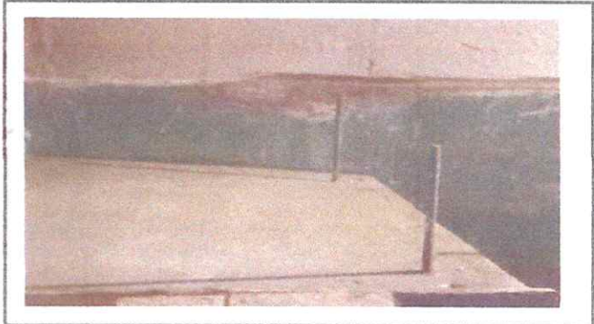
Foto 4: 20 REPARACIÓN DE COCINA 20.2 Sustitución de estufa rural completo