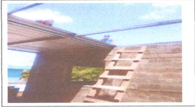
Foto1: 1-CUBIERTA DE LÁMINA 1.1 Sustitución de lámina, por lámina troquelada aluzinc. 1.3 Sustitución de elementos de fijación