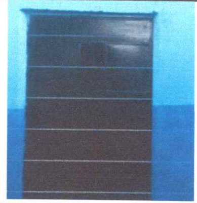
Foto: 8: Mantenimiento de esructura (lijado, cepillado, aplicación d

Observación: Si es necesario se pueden agregar hojas adicionales y actualizar el número de hojas.