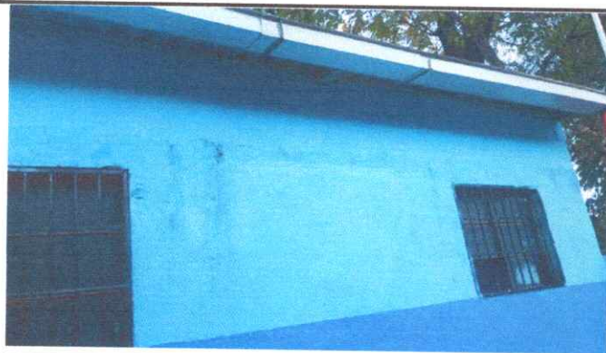
Foto 5: fabricacion e instalacion de 2 balcones de hierro en ventanas.