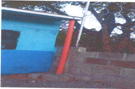
Foto 3: colocacion de canal de metal con bajada de agua pluvial, tuvo pvc 3''