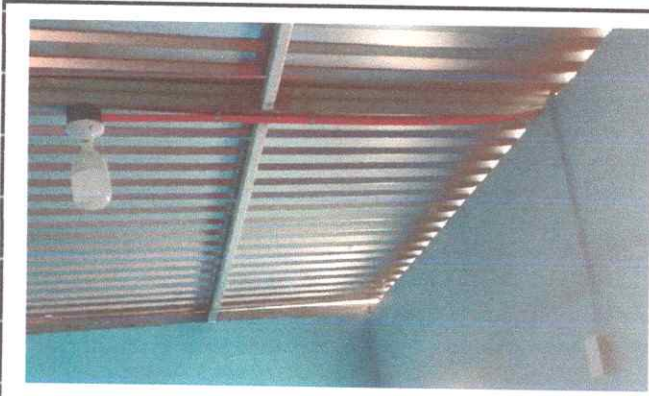
Foto: 7: Instalacion de unidad de luz ( incluye interruptor, ducto y cable electrico)