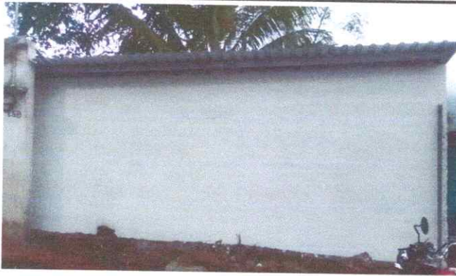
Foto1: Repello en pared frente la escuela.