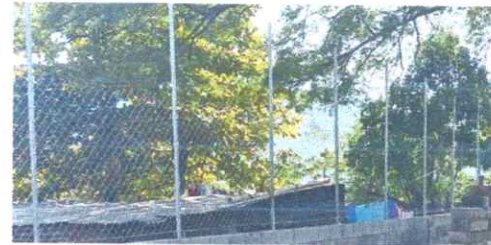
Foto6: malla deterirada, se sustituyo con tubo hg y malla galvanizada, soleras intermedias y columnas.

Observación: Si es necesario se pueden agregar hojas adicionales y actualizar el número de hojas.