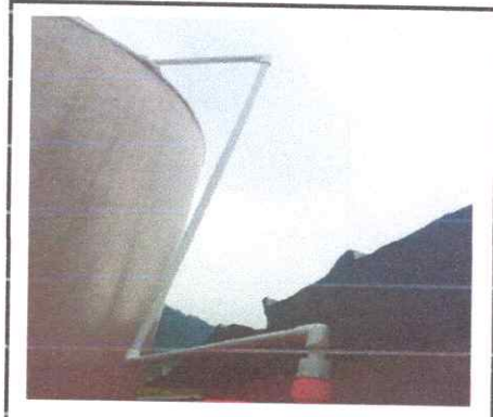
Foto: 8: Instalacion de red de agua potable para tinaco, 9 mts lineales y accesorios para tinaco.