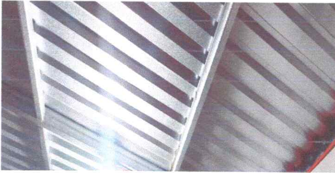
Foto1: sustitución de lamina, por lamina troquelada aluzinc