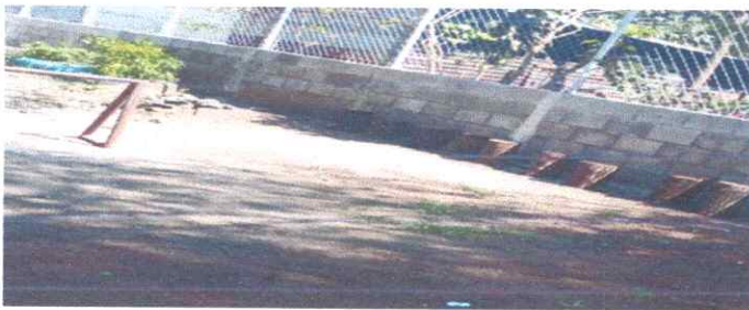
Foto5: Reparacion de muro perimetral de block.