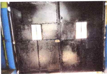
Foto 5: Mantenimiento de portón, ahora los estudiantes tienen un acceso más seguro en esa área.