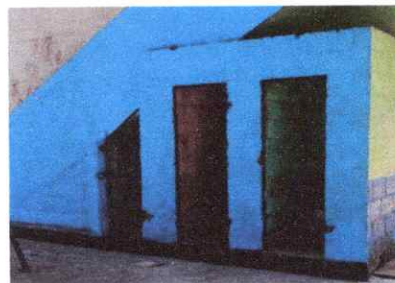
Foto 6: Pintura en puertas y área de sanitarios y en muros exteriores.

Observación: Si es necesario se pueden agregar hojas adicionales y centralizar al final de las hojas.