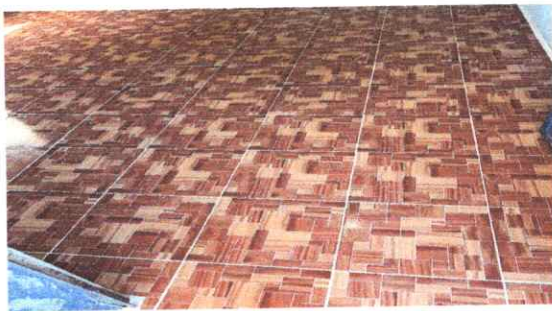
Foto 11: Colocación de piso cerámico en área de cocina, dando un lugar limpio.