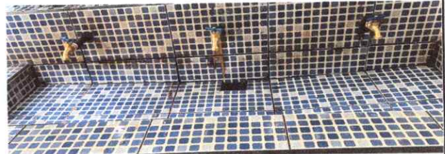
Foto 10: Colocación de 12 chorros, haciendo que los estudiantes tengan acceso a mejoras en las red de drenajes.