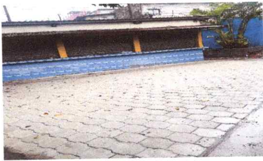
Foto7: Losa de patio terminada con adoquín.