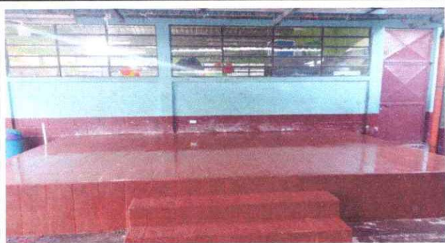
Foto1: Esenario ya terminado con su azulejo