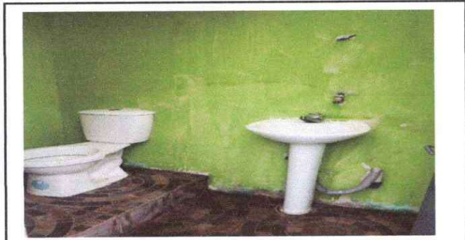
Foto1: Cambio de accesorios en 4 baños colocación de azulejos, cambio de piso mantenimiento de pintura y Cambio de techo en baños existentes