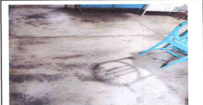
Foto 2: Sustitución de Piso de concreto por piso Ceramico en 4 aulas.