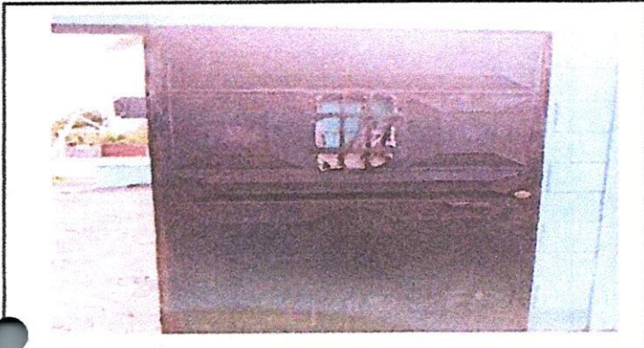
Foto 1: 4. PUERTAS DE METAL. RENGLÓN 4.1. MANTENIMIENTO A ESTRUCTURA (LIJADO, CAMBIO DE TUBO, CEPILLADO, SUJECIONES, APLICACIÓN DE PINTURA)