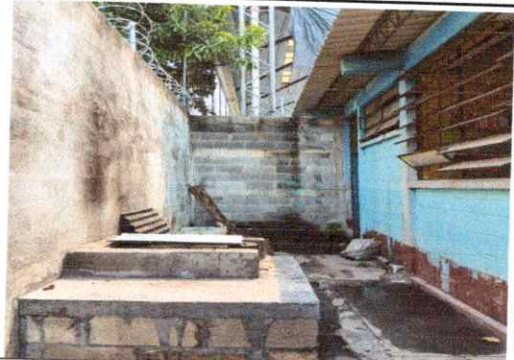
Foto 8: Area de cocina sin techo, Reglones 19.7, 18.8 (Intalacion de estructura portante de metal, Instalacion de lamina troquelada aluzinc calibre 26)