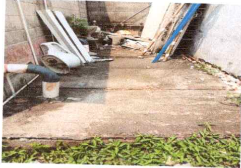
Foto 7: Tapadera de fosa septica dañada, Region 14.5 (Reparacion de tapaderas de cajas)