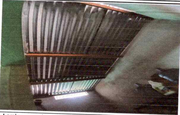
Foto 1: Lamina en mal estado, Region 1.1 (sustitucion de lamina por lamina troquelada aluzinc calibre 26).