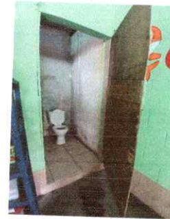
Foto 4: Puerta de madera en baño en mal estado, Region 4.2 (Sustitucion de puertas).