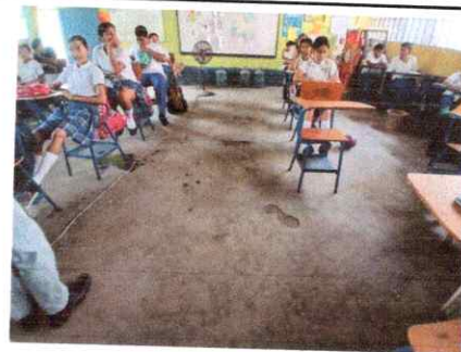
Foto 6: Piso en mal estado, Region 6.8 (Sustitucion de piso ceramico).

Observación: Si es necesario se pueden agregar hojas adicionales y actualizar el número de hojas.