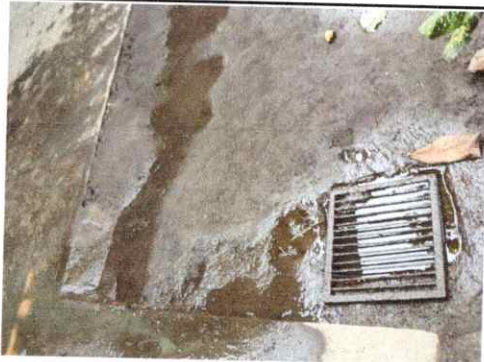
Foto 9: Drenaje colapsado, Region 19.18 (Instalacion de tuberia principal PVC)