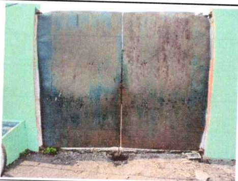
Foto 5: Porton en mal estado, Region 4.5 (sustitucion de porton de metal)