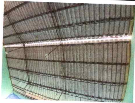
Foto 2: Capote en mal estado, Region 1.2 (Sustitucion de capote para lamina troquelada).