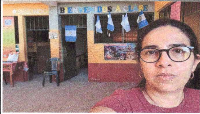
Foto1: Foto consultor