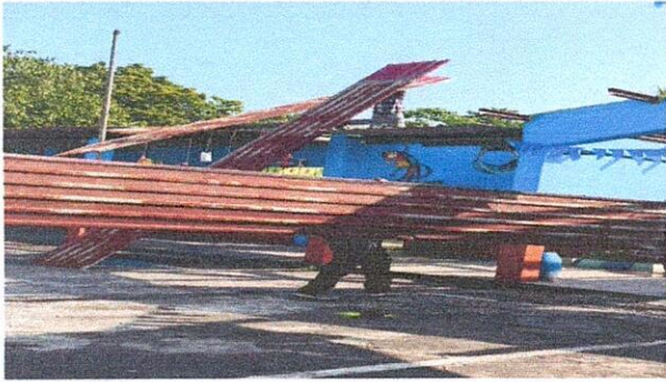
Foto 1: Enlaminado en mal estado, Region 1.1 (Sustitución de lamina por lamina troquelada aluzinc calibre 26), Region 1.3 (Sustitución de elementos de fijación), Region 19.8 (Instalación de lamina troquelada aluzinc) Region 19.10 (Desinstalación de lamina existente).