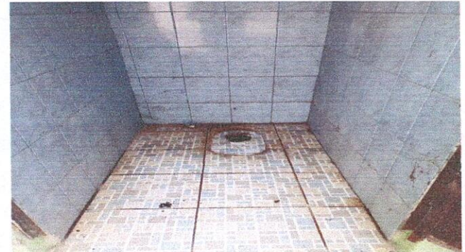
Foto 4: Inodoros en mal estado, Region 10.3 (Sustitución de inodoro), Region 19.15 (Instalación de inodoro).