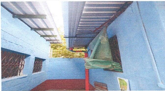
Foto 3: Canal en mal estado, Region 7.1 (Sustitución de canal de metal).