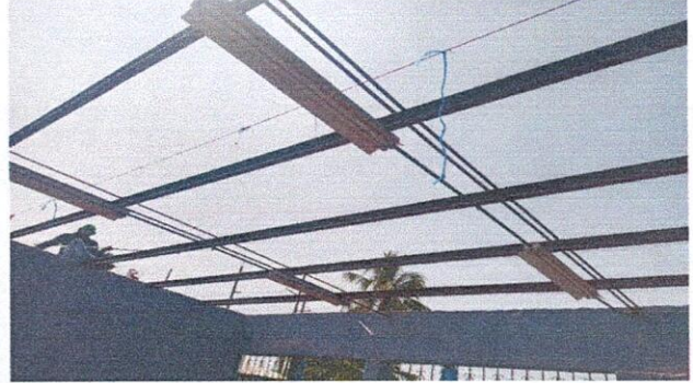
Foto 2: Estructura portante deteriorada, Region 2.1 (Mantenimiento de estructura de metal)