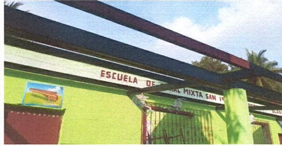
Foto 2: Pintando las costaneras para poder colocar las láminas nuevas.