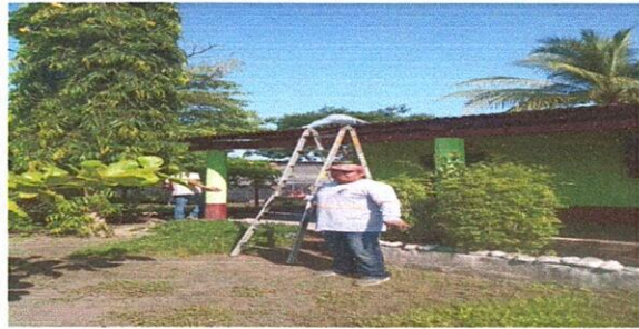
Foto1: En está imagen se puede observar que inician a quitar la lámina del corredor y continúan con la lámina de las aulas.