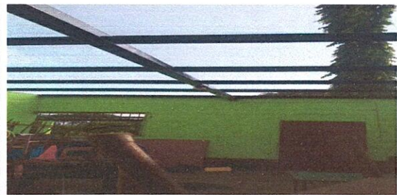
Foto 3: Se puede observar las aulas sin láminas a punto de colocar la lámina nueva.