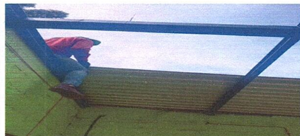
Foto 5: Se puede observar que están colocando las láminas nuevas tanto en las aulas como en el corredor.