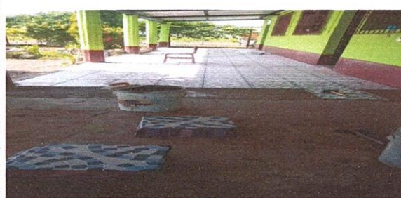
Foto 4: Se puede ver que se está pegando la cerámica al piso rustico.