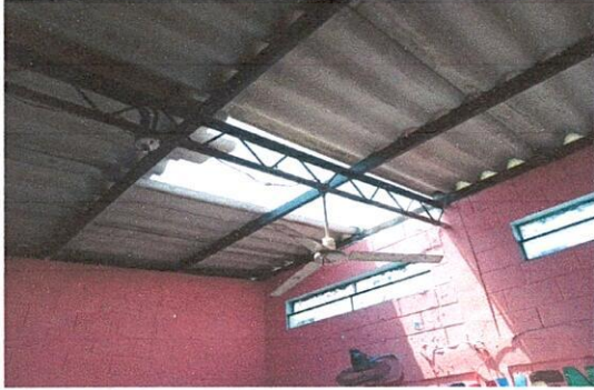
Foto 1: Lamina en mal estado, Region 1.1 (Sustitucion de lamina por lamina troquelada aluzinc calibre 26). Region 19.8 (Instalación de lamina troquelada aluzinc). Region 19.10 (Desinstalación de lamina existente).