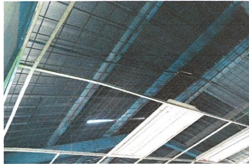
Foto 4: Estructura deteriorada, Region 2.1 (Mantenimiento a estructura de soporte de metal).