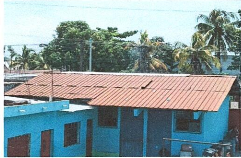
Foto 2: Capote en mal estado, Region 1.2 (Sustitucion de capote para lamina troquelada).