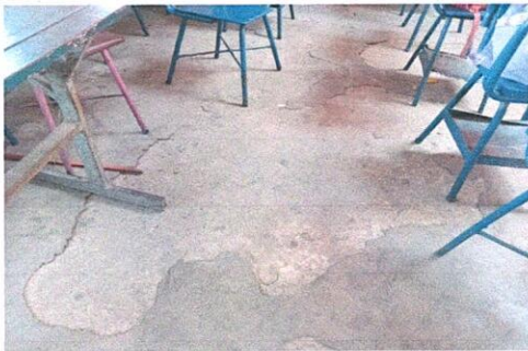
Foto 5: Piso en mal estado, Region 6.8 (Sustitucion de piso ceramico).

Observación: Si es necesario se pueden agregar hojas adicionales y actualizar el número de hojas.