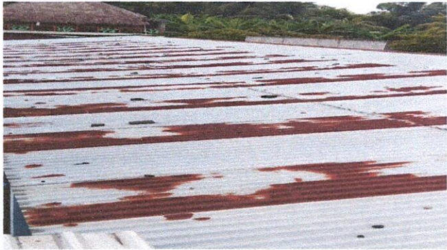
Lámina en mal estado, sustitución de lámina por lámina troquelada