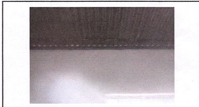
Foto 4: Estructura deteriorada, Region 2.1 (Mantenimiento a estructura de soporte de metal).