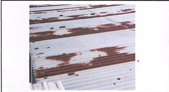
Foto1: Lamina en mal estado, Region 1.1 (Sustitucion de lamina por lamina troquelada aluzinc calibre 26). Region 19.8 (Instalación de lamina troquelada aluzinc). Region 19.10 (Desinstalación de lamina existente).