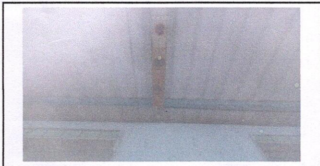
Foto 4: Lamparas y tomacorrientes en mal estado Region 17.5 (Sustitución de plafoneras) Region 17.8 (Sustitución de tomacorrientes dobles) Region 19.11 (Instalación de unidades luz (incluye interruptor, ducto y cable eléctrico) Region 19.12 (Instalación de unidades fuerza (tomacorriente), incluye cable eléctrico)

Observación: Si es necesario se pueden agregar hojas adicionales y actualizar el número de hojas.