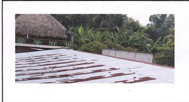
Foto 2: Capote en mal estado, Region 1.2 (Sustitucion de capote para lamina troquelada).